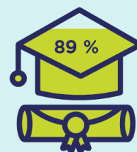
TAUX DE RÉUSSITE DES SORTANTS 2019